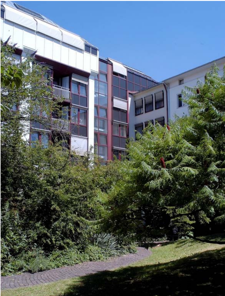
Abbildung: Klinik mit begrünem Innenhof

Sehr geehrte Damen und Herren, wir freuen uns, dass Sie sich für unsere Einrichtung interessieren!